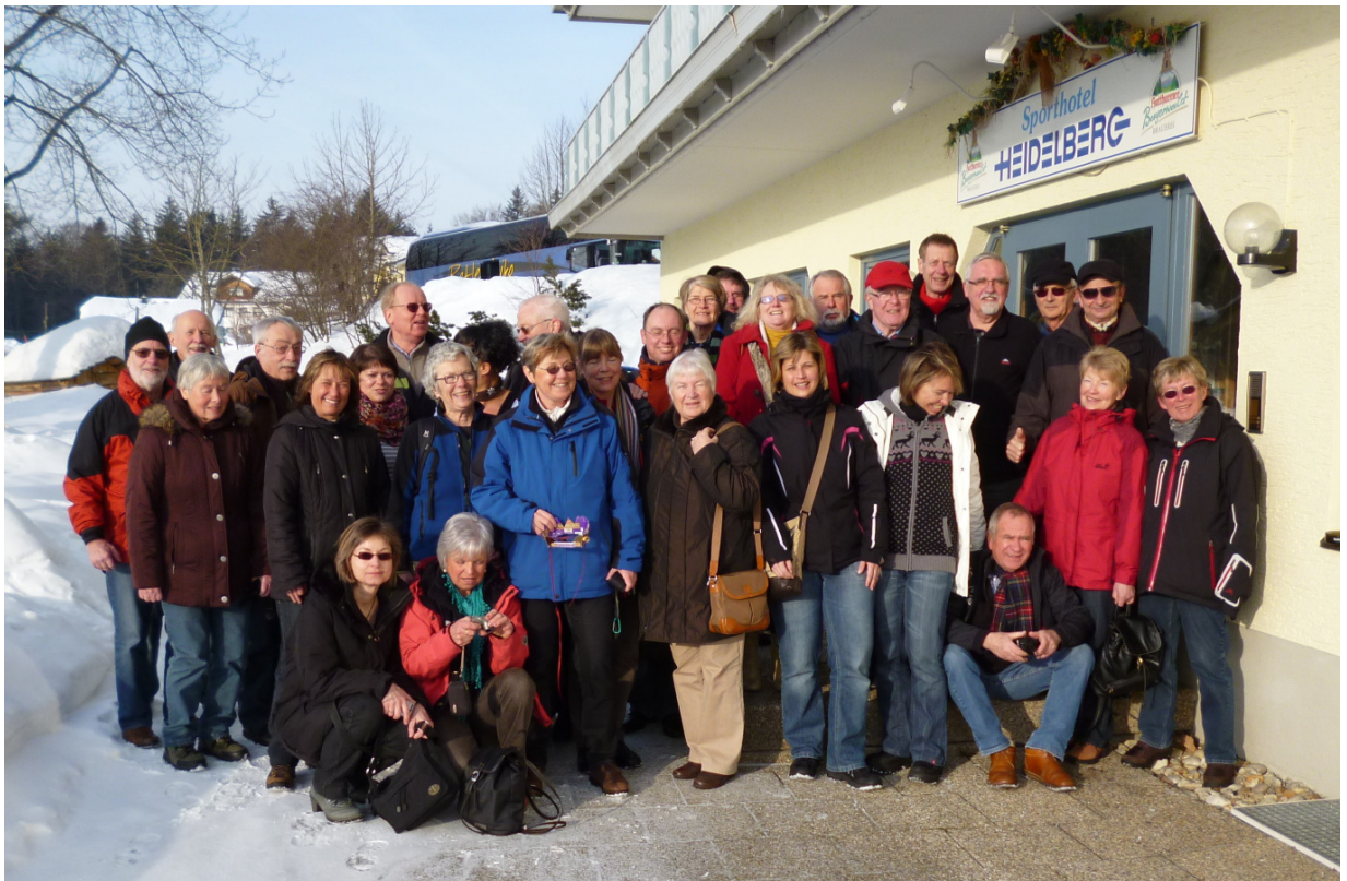
So sehen entspannte und zufriedene „Skihasen“ aus

Eine Gruppe von 32 MTV-Mitgliedern weilte Ende Januar im Bayerischen Wald. Auf dem Programm standen Langlauf und Wandern. Schnee gab es reichlich, so dass die Bedingungen für eine Ski-Woche ideal waren. Täglich verabredete man sich in gleichstarken Gruppen für Touren durch die Wälder in und um Schönau sowie zwischen St. Oswald und Finsterau an der tschechischen Grenze. Dabei wurden Tagesentfernungen zwischen 10 und 30 km zurückgelegt. Die Neulinge erhielten unter fachkundiger Anleitung den nötigen Schliff und konnten am Ende des Kurses in ihren Gruppen gut mithalten und so entspannt in den Loipen die Bergwelt genießen.